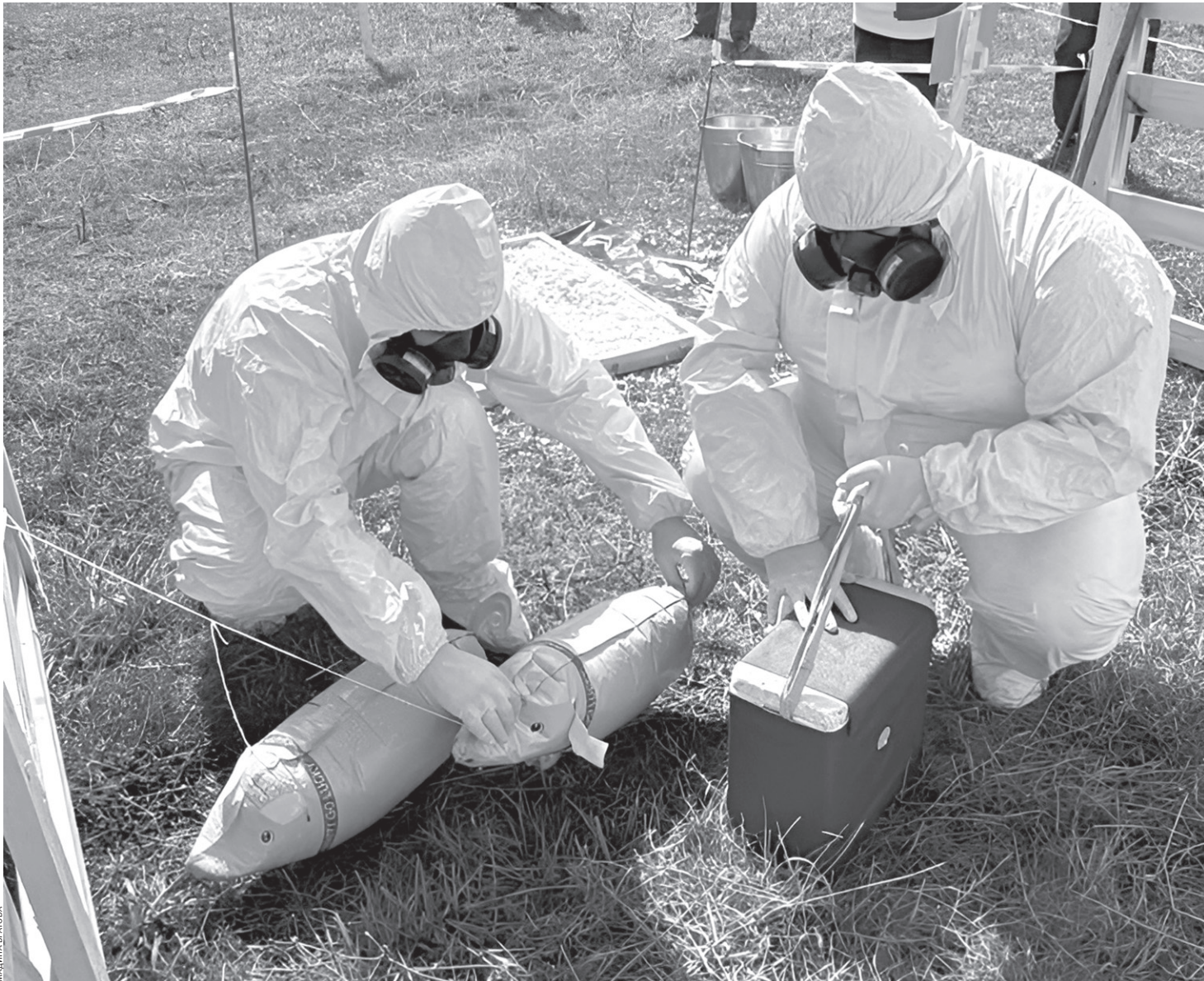
Ветеринары на учениях работали сплоченно и организованно

В Карачаево-Черкесии такие учения проводят уже пятый год подряд, при этом площадку ежегодно меняют. В этот раз они прошли в Прикубанском районе. По легенде учений, в личном подсобном хозяйстве был выявлен поросенок с признаками африканской чумы свиней. Напомним, африканская чума свиней — это опасная заразная болезнь домашних, диких и декоративных свиней. В ходе теоретической части были рассмотрены вопросы профилактики, контроля, лабораторно-диагностических исследований и порядок оформления документов при проведении противоэпизоотических мероприятий. В