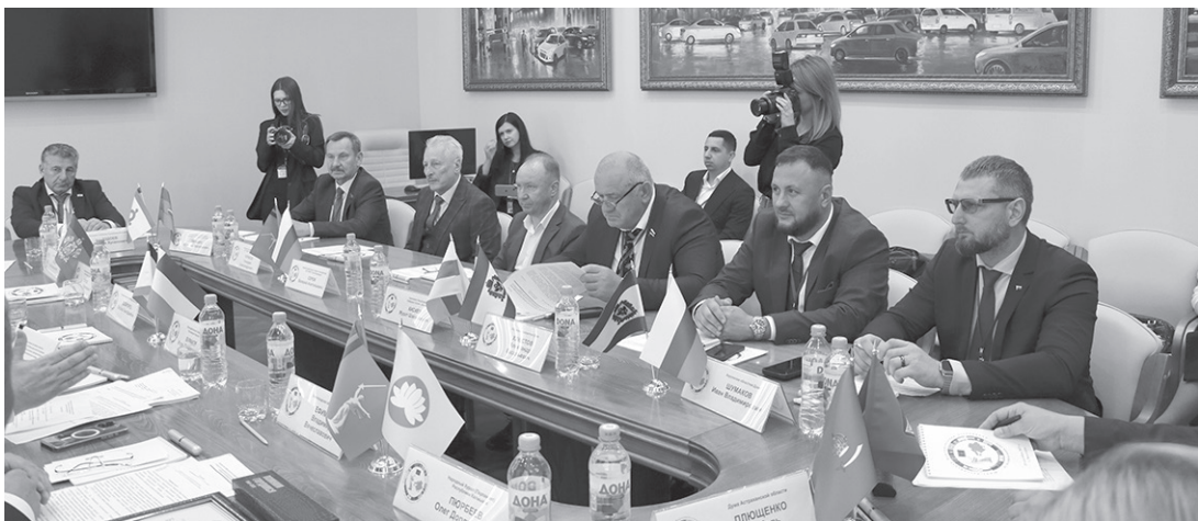
Парламентарии обсуждают законодательные инициативы, внесенные на конференции ЮРПА

По информации пресс-службы Парламента КЧР